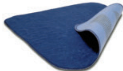
art nr 1296AH