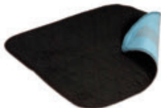
art nr 1299AH

Snygga och diskreta sittskydd som förhindrar läckage på möblerna. Sittskydd i mjuk velour med ett vätsketätt spärrskikt i botten och en kärna av högabsorberande material. Med antihalkbeläggning på baksidan. Klarar ca 450 tvättar, 90°C (normal hushållstvätt). Bör tvättas innan användning.