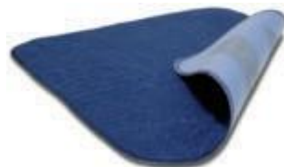
art nr 1296AH