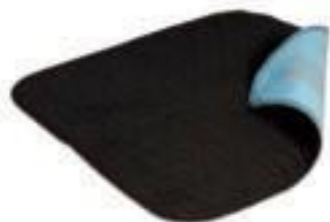
art nr 1299AH

Snygga och diskreta sittskydd som förhindrar läckage på möblerna. Sittskydd i mjuk velour med ett vätsketätt spärrskikt i botten och en kärna av högabsorberande material. Med antihalkbeläggning på baksidan. Klarar ca 450 tvättar, 90°C (normal hushållstvätt). Bör tvättas innan användning.