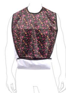
För spillficka – vik och tryck ihop tryckknapparna