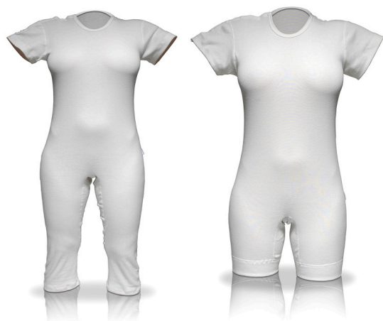
Sanicare art nr 6202

Sanicare nattdräkt underlättar vården av dementa och inkontinenta patienter. Inkontinenshjälpmedlet sitter skyddat och därmed minskar risken för läckage och onödiga byten, vilket resulterar i en ostörd nattsömn. Den heltäckande nattdräkten är öppningsbar på höger axeln, och försvårar för patienten att själv ta av sig inkontinensskyddet. Passar både till män och kvinnor.