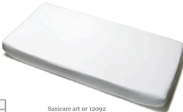
Sanicare art nr 12092

Tvättbara madrassskydd med vätskespärren skyddar effektivt mot väta, fläckar och nedsmutsning. Vätskespärren förhindrar dessutom att dam och kvalster vandrar mellan sängkläder och madrass. Resår i sidorna gör att skyddet ligger stilla i sängen. Obs! Använd ej sköljmedel!