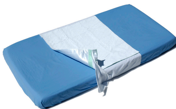
Sanicare art nr 12421 med bäddflikar