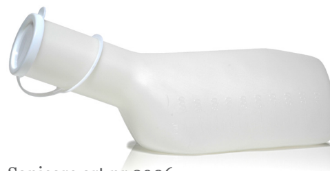
Sanicare art nr 2906