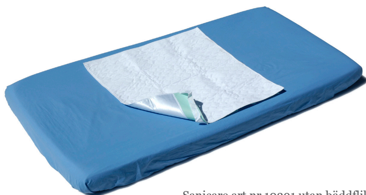
Sanicare art nr 10391 utan bäddflikar

Kombiglid har ett vätsketätt spärrskikt i botten och en kärna av högabsorberande material. Kombiglid har en under-sida av lågfriktionsmaterial och handtag som underlättar vändning. Ytskiktet är i borstad polyester om gör att ytan känns torr även efter läckage. Lakansskyddet är laminerat vilket gör det mycket starkt och resulterar i en slät bäddyta utan risk för inre veck i produkten. Obs! Använd ej sköljmedel vid tvätt!