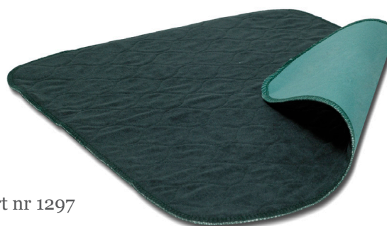
Sanicare art nr 1297