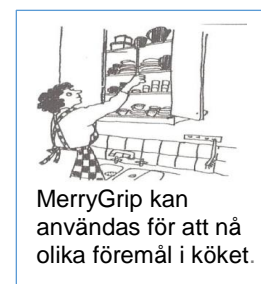
MerryGrip kan användas för att nå olika föremål i köket.