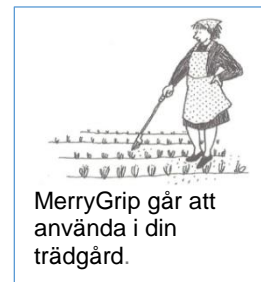
MerryGrip går att använda i din trädgård.