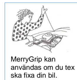
MerryGrip kan användas om du ska fixa din bil.