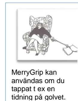
MerryGrip kan användas om du tappat t ex en tidning på golvet.